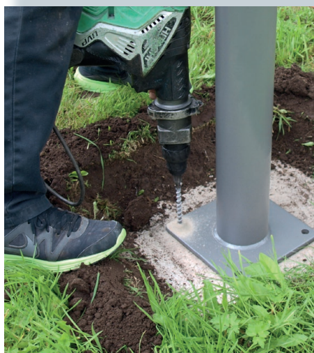
Drill bolt holes with a concrete hammer.