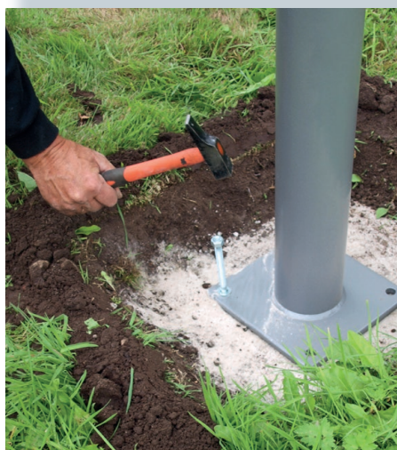
Mount the M20 concrete bolts.