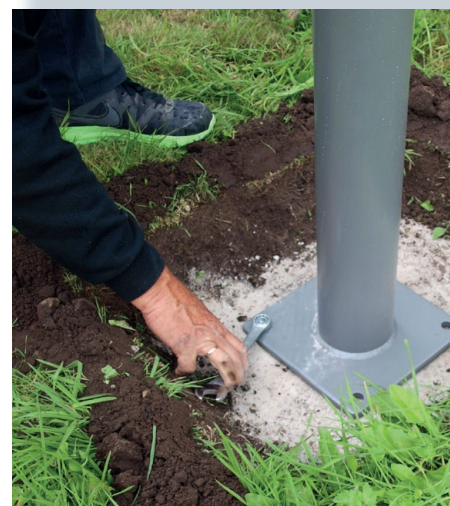
Tighten the anchors and M20 = 120 N/m).