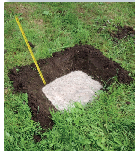
Fill with concrete leaving a depth of e.g. 25/40 cm / 10"/16" (see the following pages). Dry for approx. 6-7 days.