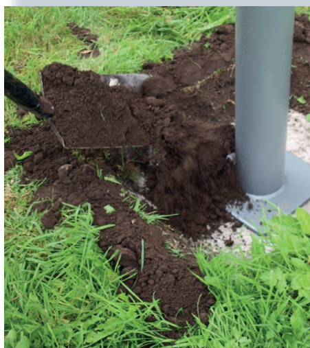
Make sure the fitness station is stabil and properly fastened before filling with dirt to the ground line.