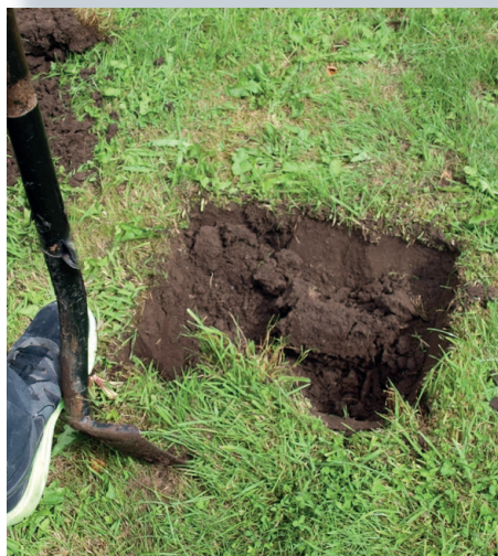
Dig holes according to positions on drawings (see the following pages).