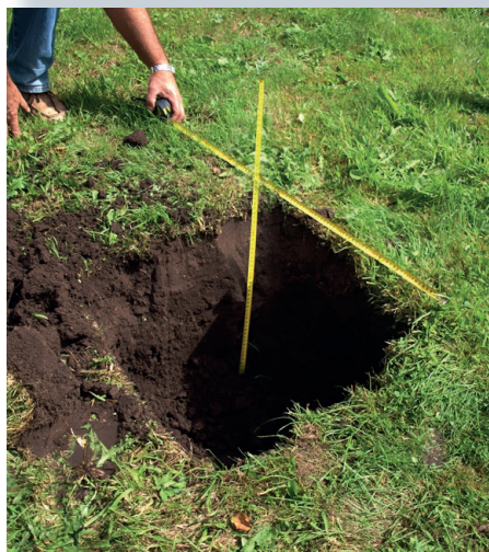
Dimensions of holes: e.g. 50 x 50 x 75 cm / 20" x 20" x 30" (see the following pages).